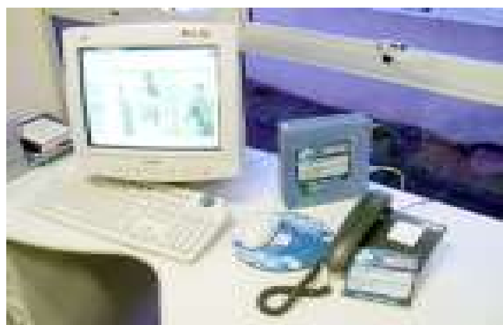
Computador equipado com o Power Line Communications (PLC): alta velocidade na transferência de dados

Para a população, é uma via direta à inclusão digital, disponibilizando o serviço de banda larga em regiões geográficas do Estado onde os concorrentes atuais de telecomunicações não têm oferta (a infra-estrutura elétrica da Celg cobre hoje 98% do território goiano).