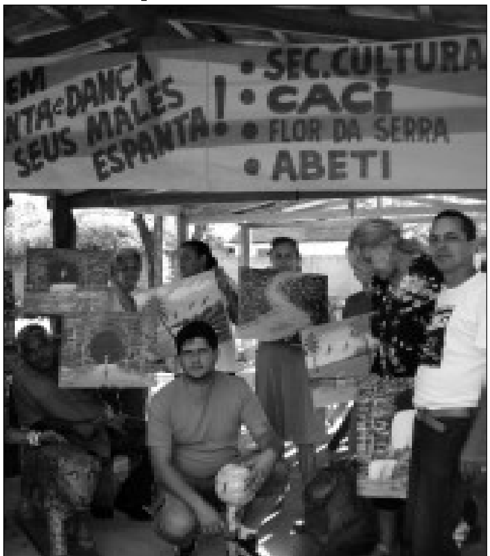
Projeto "Quem pinta seus males espanta" traz clube da melhor idade para realizar atividades na sede da secretaria de Cultura. Leia na Pág 3.

Não sabe onde anunciar? Fone: (64) 3453-8883