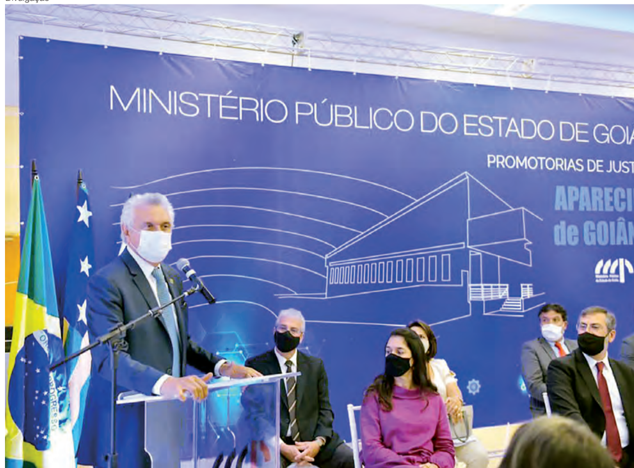
Governador Ronaldo Caiado participa de inauguração da sede do Ministério Público, em Aparecida de Goiânia: “Eu me coloco como aliado a todo momento”