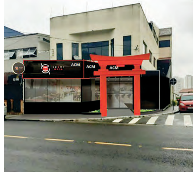
A casa está com inauguração prevista para Janeiro/2021

Indo na contramão da crise econômica que se instalou no país por conta da pandemia do novo Coronavírus, na qual 12 mil estabelecimentos foram fechados somente na capital paulista entre abril e junho segundo a Abrasel (Associação Brasileira de Bares e Restaurantes), dois empreendedores da Zona Leste de São Paulo projetam abrir até o início de 2021 o seu quarto restaurante, dessa vez em Guarulhos.