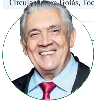
■ HD Hércules Dias www.herculesdias.com.br