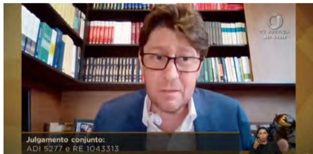
Julgamento conjunto: ADI 5277 e RE 1043313

Toffoli fez questão de registrar o ocorrido, ao lembrar que passou por procedimentos médicos e foi alvo de “interpretações piores possíveis”