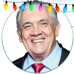
■ HD Hércules Dias www.herculesdias.com.br