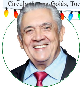
■ HD Hércules Dias www.herculesdias.com.br