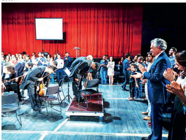
Em janeiro começam as atividades e apresentações da Orquestra Filarmônica de Goiás: na programação há um projeto de educação musical virtual para crianças em condições de vulnerabilidade