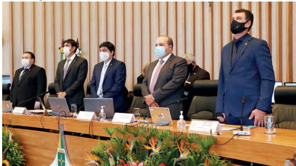
O governador Ibaneis Rocha anunciou o empenho do GDF na recuperação da economia durante a sessão de posse da nova Mesa Diretora da CLDF