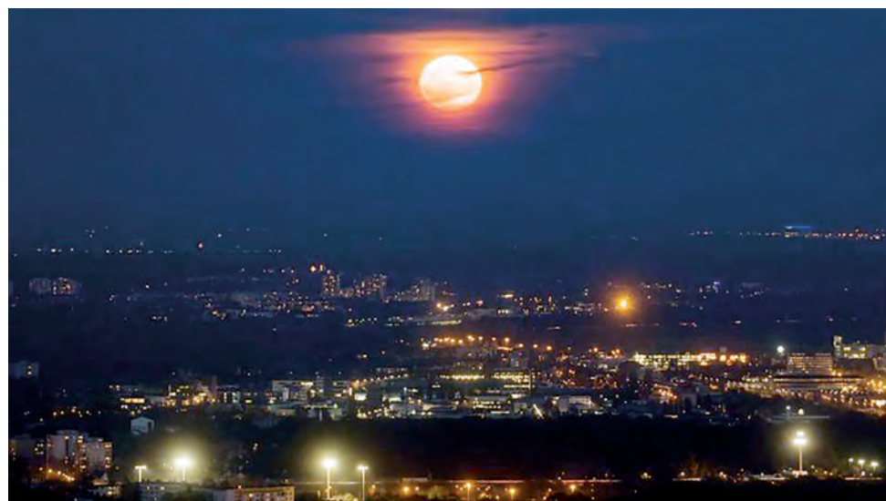
A superlua é um fenômeno apreciável em todo o mundo