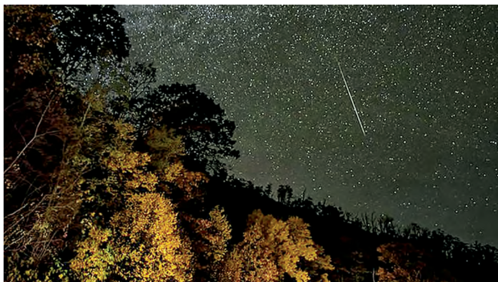
Meteoros percorrem a atmosfera, criando um espetáculo visual