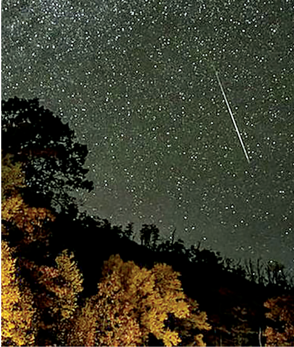
Meteoros percorrem a atmosfera, criando um espetáculo visual