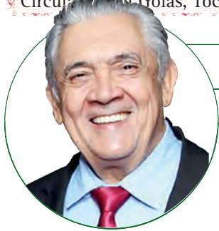
■ HD Hércules Dias www.herculesdias.com.br