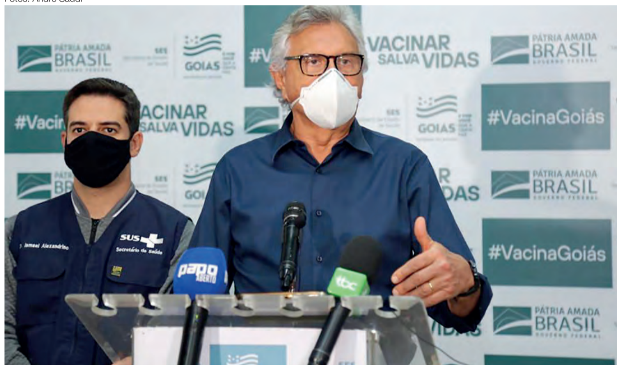
Governador Ronaldo Caiado e secretário estadual da Saúde, Ismael Alexandrino, recebem mais 187 mil doses de vacina contra Covid-19: imunização avança entre terceira idade, trabalhadores da saúde e das forças de segurança e salvamento