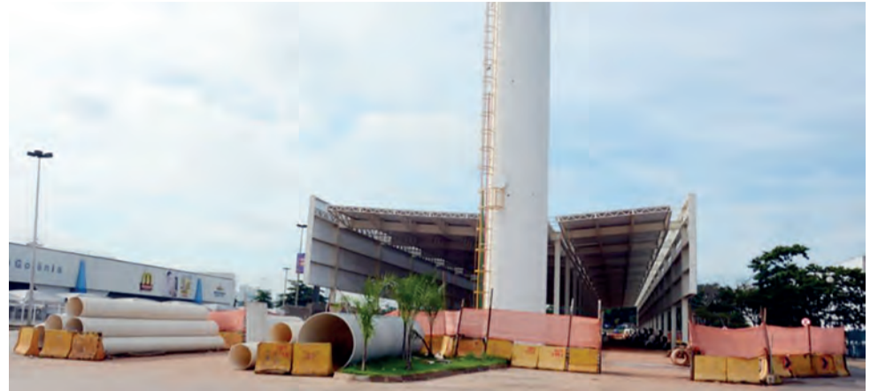
Terminal Rodoviária, do BRT, poderá ter movimentação diária de 12 mil pessoas em Goiânia