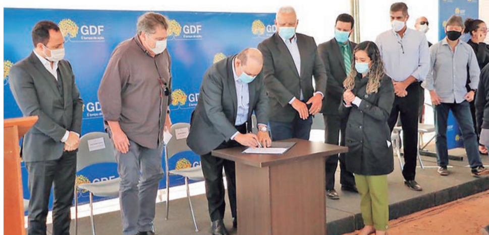
Governador Ibaneis Rocha, durante Assinatura de os para a 1ª etapa das obras de implantação do Parque Burle Marx.

O governador Ibaneis Rocha assinou a ordem de serviço que deu início à primeira etapa de implantação do Parque Ecológico Burle Marx, localizado no Setor Noroeste. As intervenções previstas para a unidade de conservação, que será a 83ª do DF, contam com investimentos de aproximadamente R$ 6,8 milhões da Companhia Imobiliária de Brasília (Terracap).