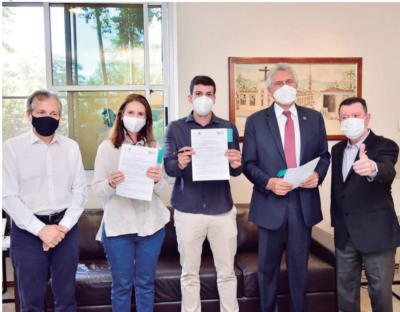
Governador Ronaldo Caiado e presidente Pedro Sales na assinatura de convênio com Prefeitura de Porangatu, cidade que recebe projeto piloto do Goiás em Movimento - Eixo Municípios