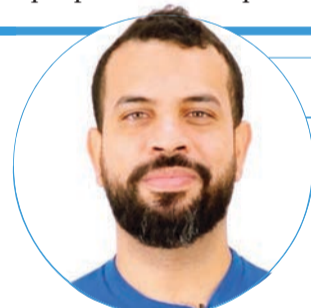
■ Leonardo Chucrute

O clitóris fica coberto pelo capuz, uma pele que cobre sua glândula (ou cabeça), o chamado "botãozinho", com cerca de meio centímetro (mas que, quando estimulado, pode aumentar de tamanho). Aliás, a glândula do clitóris é a parte