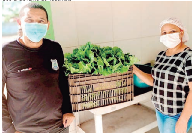
Hortaliças excedentes são sempre doadas para órgãos, entidades e pessoas em situação de vulnerabilidade

tipo de iniciativa para a reinserção social. “Nós priorizamos estas ações e benfeitorias para a população, pois estes atos servem para mostrar que o preso pode oferecer serviços e bens de qualidade para melhorar a vida das pessoas, além de terminar de vez com o estereótipo de que quem vive em situação de cárcere não merece uma oportunidade social”.