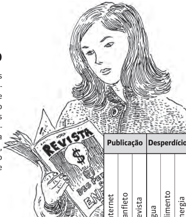
ILUSTRAÇÃO: DIEGO SANCHEZ

Recentemente, três mulheres leram ótimos artigos sobre maneiras de evitar o desperdício em suas casas. A partir das dicas abaixo, descubra o nome de cada uma, onde leu o artigo e o tipo de desperdício de que se trata.