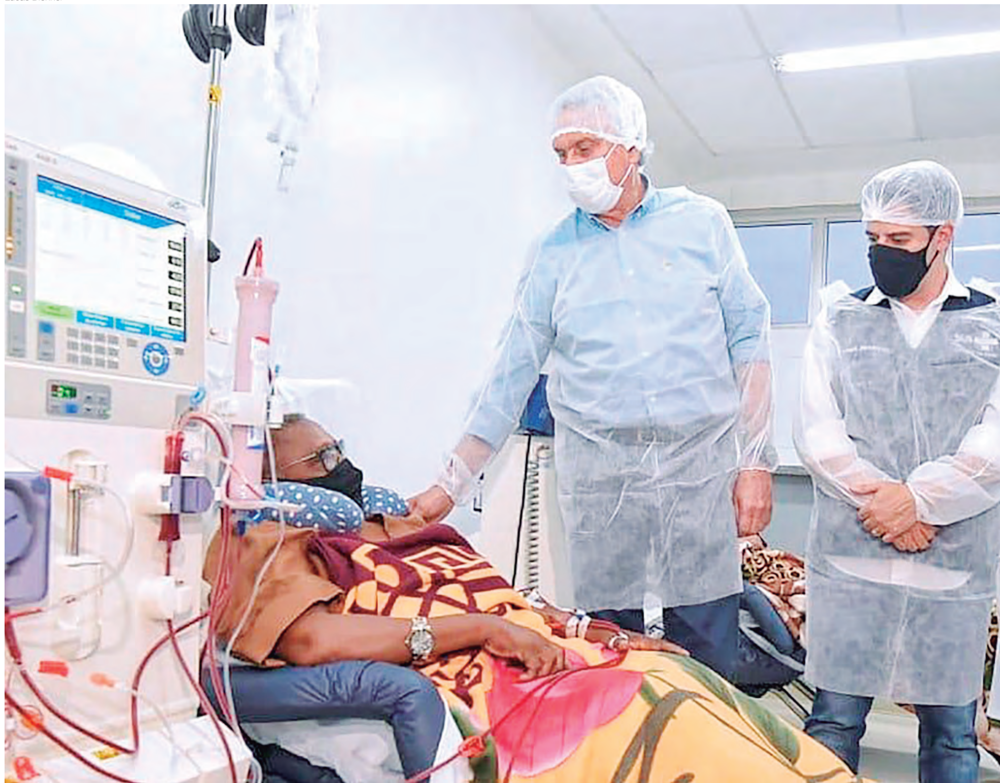
Governador Ronaldo Caiado durante inauguração de 10 leitos de UTI geral para adultos, em Morrinhos: “O interesse nosso é levar saúde a todas as regiões”

SECOM/GO - Com investimentos de mais de R$ 5,8 milhões, o governador Ronaldo Caiado inaugurou, nesta quinta-feira (23), em Morrinhos, na região Sul, 10 leitos de Unidade de Terapia Intensiva (UTI) no Hospital Municipal. Estado e prefeitura firmaram parceria para entrega da estrutura, que receberá cofinanciamento estadual e será regulada pela Secretaria de Estado da Saúde. A medida é importante para o