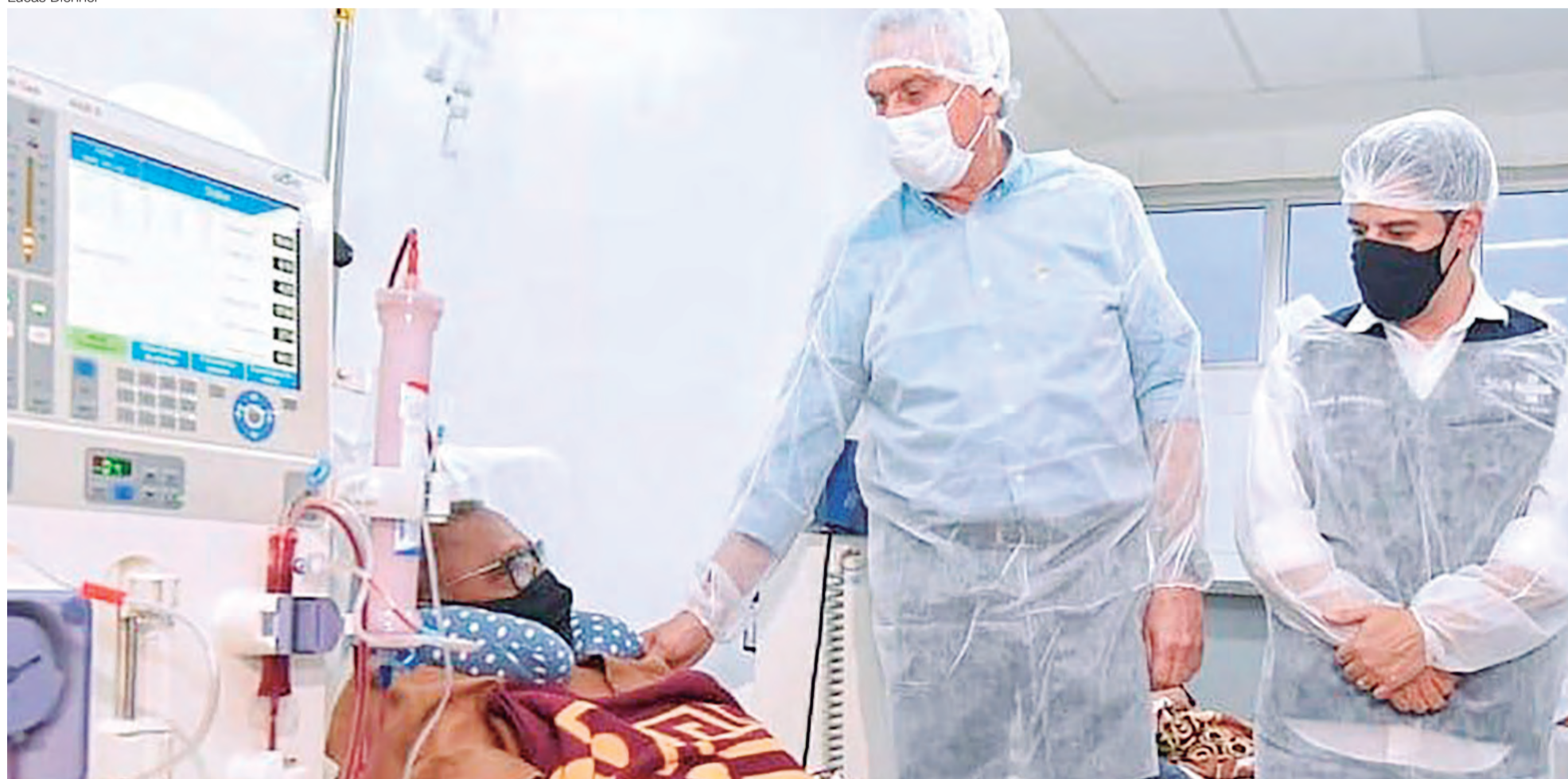
Governador Ronaldo Caiado durante inauguração de 10 leitos de UTI geral para adultos, em Morrinhos: “O interesse nosso é levar saúde a todas as regiões”