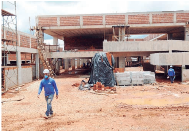
Obras de construção da escola técnica da cidade avançam: mais qualidade de vida

coberta. O modelo segue o padrão do Fundo Nacional de Desenvolvimento da Educação (FNDE).