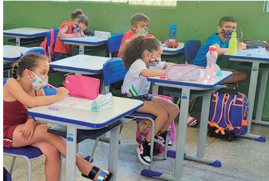
Avaliação Diagnóstica está sendo aplicada para educandos de 1º a 9º ano. Resultados dos testes vão nortear as ações da Secretaria Municipal de Educação em 2022

Um dos maiores desafios da retomada das aulas em 2022 é a recuperação das aprendizagens. Pensando nisso, a Prefeitura de Goiânia iniciou nesta semana a aplicação da Avaliação Diagnóstica para alunos matriculados nas instituições municipais. O objetivo dessa avaliação é identificar os impactos da pandemia na Educação e aferir os níveis de aprendizagem no período em que o atendimento foi realizado de maneira escalonada.