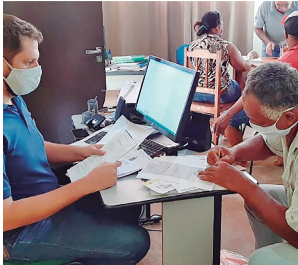
Ação visa facilitar acesso do produtor ao crédito rural

MÁRCIA ROSA/GOVERNO DO TOCANTINS - O Governo do Tocantins, por meio do Instituto de Desenvolvimento Rural do Tocantins (Ruraltins), realizará nesta segunda-feira, 14, às 9 horas, na Câmara municipal de Almas, o Mutirão do Agrocrédito para região sudeste. Esta ação, que ocorrerá durante toda a semana, contemplará também os produtores rurais dos municípios de Porto Alegre do Tocantins, Dianópolis, Novo Jardim e Rio da Conceição.