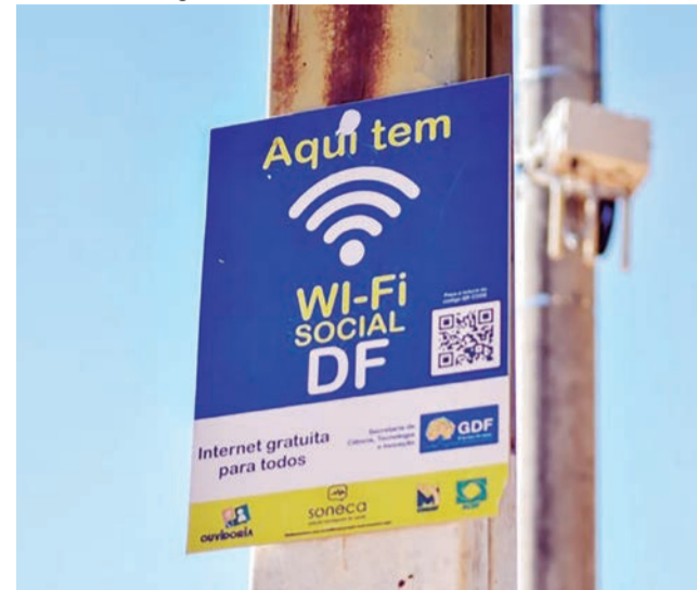
Projeto do GDF promove inclusão digital, com acesso gratuito à internet em mais de 70 pontos

gente que não tem um pacote de dados, promovendo a inclusão digital e social da população. Com 72 pontos de internet gra-