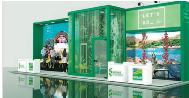
Estado estará presente no maior evento da indústria de viagens da América Latina

No estande da Goiás Turismo estará presente a diversidade turística do Estado nos segmentos de Ecoturismo/Aventura e Negócios/Entretenimento, com a participação de empresários da Chapada dos Veadeiros; Caminho de Cora Coralina e Região Turística do Ouro e Cristais; Região das Águas e Cavernas do Cerrado; Região das Águas Quentes; e da capital Goiânia com sua Moda, Música Sertaneja e Eventos. Todos os elementos serão apresentados de acordo com a nova marca do turismo goiano - Bora pra Goiás. Este é um convite para que o turista viva experiências que só Goiás proporciona. A proposta da campanha é vender a imagem do turismo goiano, por meio de uma marca conceitual, e posicionar o Estado como um dos principais destinos do Brasil. De acordo com o presidente da Goiás Turismo, Fabrício Amaral, a feira acontece no maior mercado emissor e receptivo do Brasil, o que representa uma grande oportunidade para os destinos goianos.