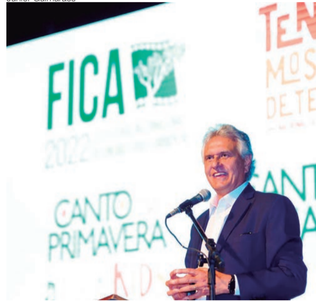
Governador Ronaldo Caiado anuncia investimentos de mais de R$ 20 milhões para a retomada cultural no Estado

do Estado de Goiás (Fecomércio), Marcelo Baiocchi.