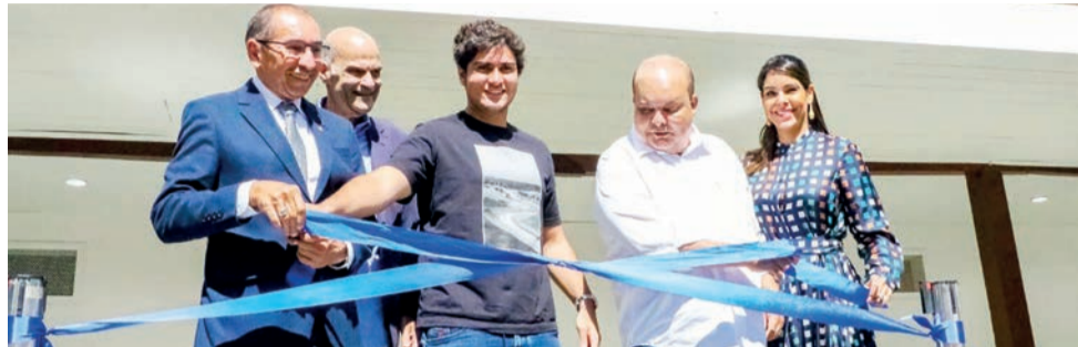
Governador Ibaneis reinaugura um dos espaços mais icônicos da capital federal

DA REDAÇÃO - Primeira residência oficial de Juscelino Kubitschek na construção de Brasília, o Catetinho reabre as portas para o público no dia em que a capital completa 62 anos. A cerimônia de reabertura foi realizada ontem, com a presença do governador Ibaneis Rocha e de outras autoridades.