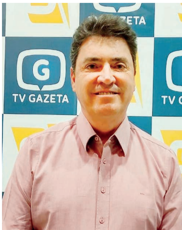
Wilder Moraes foi responsável por diversas emendas importantes no último mandato como Senador da República

Foi Secretário de Estado de Infraestrutura de Goiás, em 2011. Cumpriu o mandato como Senador de 2012 a 2019 e apresentou mais de 200 proposições legislativas