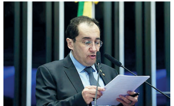
Senador Jorge Kajuru

Em pronunciamento em Plenário nessa quinta-feira (7), o senador Jorge Kajuru (Podemos-GO) defendeu a aprovação do projeto de sua autoria que protege o sigilo do processo envolvendo mãe ou gestante que pretende entregar o próprio filho para adoção. De acordo com o PL 1.836/2022, o responsável por tornar pública a informação sem o consentimento da parte envolvida responderá penal, cível e administrativamente.