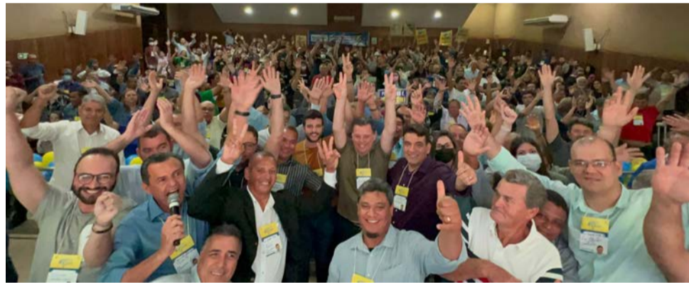
“Desperta Goiás”, em Trindade

um encontro, até o dia 16 teremos feito 35 encontros, espero vocês porque temos a verdade ao nosso lado, eu quero ter a oportunidade nessas eleições de estar de cabeça erguida, pronto para debater sobre qualquer assunto que interesse Goiás, passado, presente e futuro,