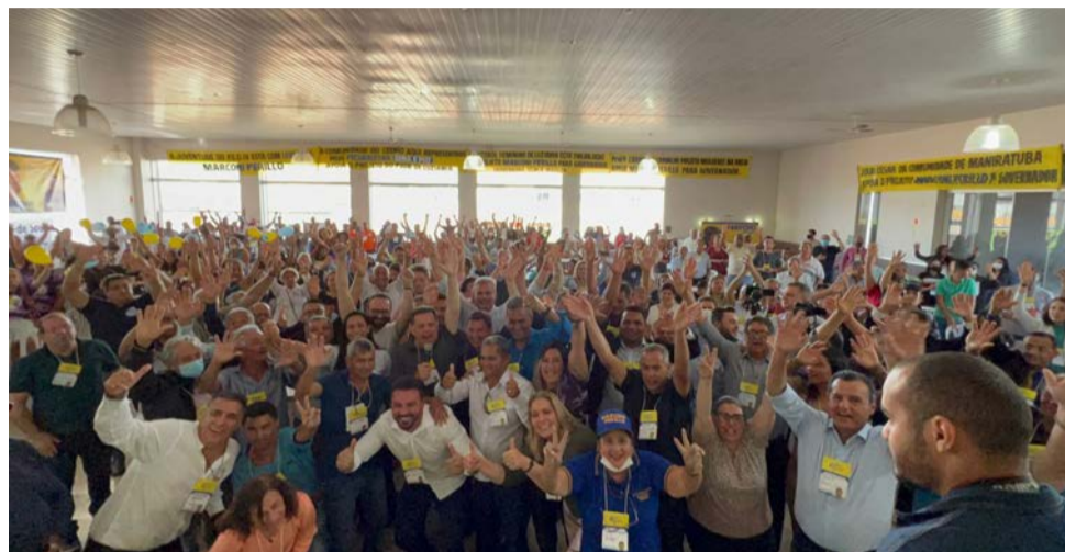
“Desperta Goiás”, em Luziânia

“Queria convidar a todos de forma enfática para estarmos juntos no dia 16, quando vamos encerrar essa fase dos encontros do “Desperta Goiás”, hoje em Trindade celebrando mais