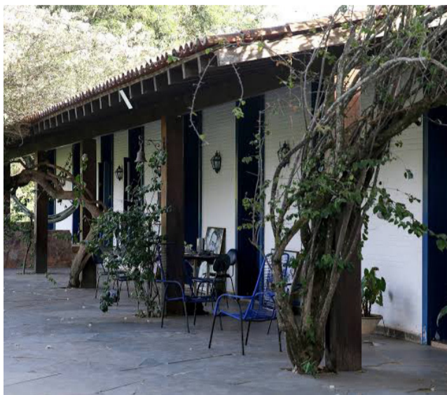
Fazendinha JK, destino turístico de Luziânia, Goiás e do Brasil