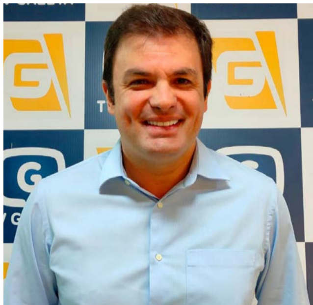
Após 23 anos no Partido Progressistas (PP), se filiou ao (MDB)

Questionado porque deixou o Partido Progressistas após 23 anos, ele respondeu que contribuiu com a formação de diretórios do