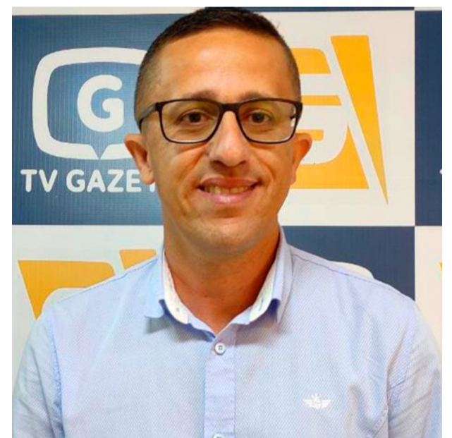
Investir nos microempreendedores é o foco da gestão nesse momento

Cidade de Vianópolis foi premiada pelo Sebrae como “cidade empreendedora”, e para solucionar o problema da falta de mão de obra qualificada tem