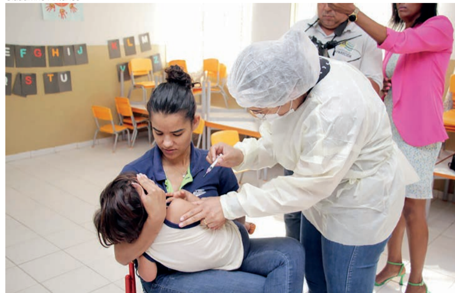
Aparecida de Goiânia inicia vacinação contra Covid-19 em crianças a partir dos três anos de idade

A Secretaria de Saúde de Aparecida de Goiânia (SMS) começou a vacinar contra a covid-19 todas as crianças com três anos de idade ou mais nesta quarta-feira, 20 de julho. Até então, a vacinação infantil estava autorizada apenas para o público acima de 5 anos. A ampliação do grupo segue recomendação do Ministério da Saúde, que após pesquisas e debates considerou que a imunização de crianças de 3 a 4 anos, 11 meses e 29 dias com a vacina Coronavac é segura e eficaz, evitando infecções, agravamento e óbitos pela contaminação com o novo coronavírus.