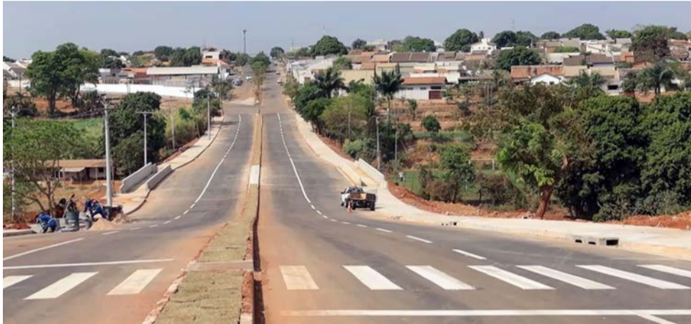
Ponte Eixo Leste Oeste

Eixo Leste-Oeste 01 passa por setores como Goiânia Park Sul, Buriti Sereno, Bairro Cardoso e Jardim Helvécia e possibilita diminuir drasticamente o tempo de deslocamento da GO-040 à Avenida Rio Verde