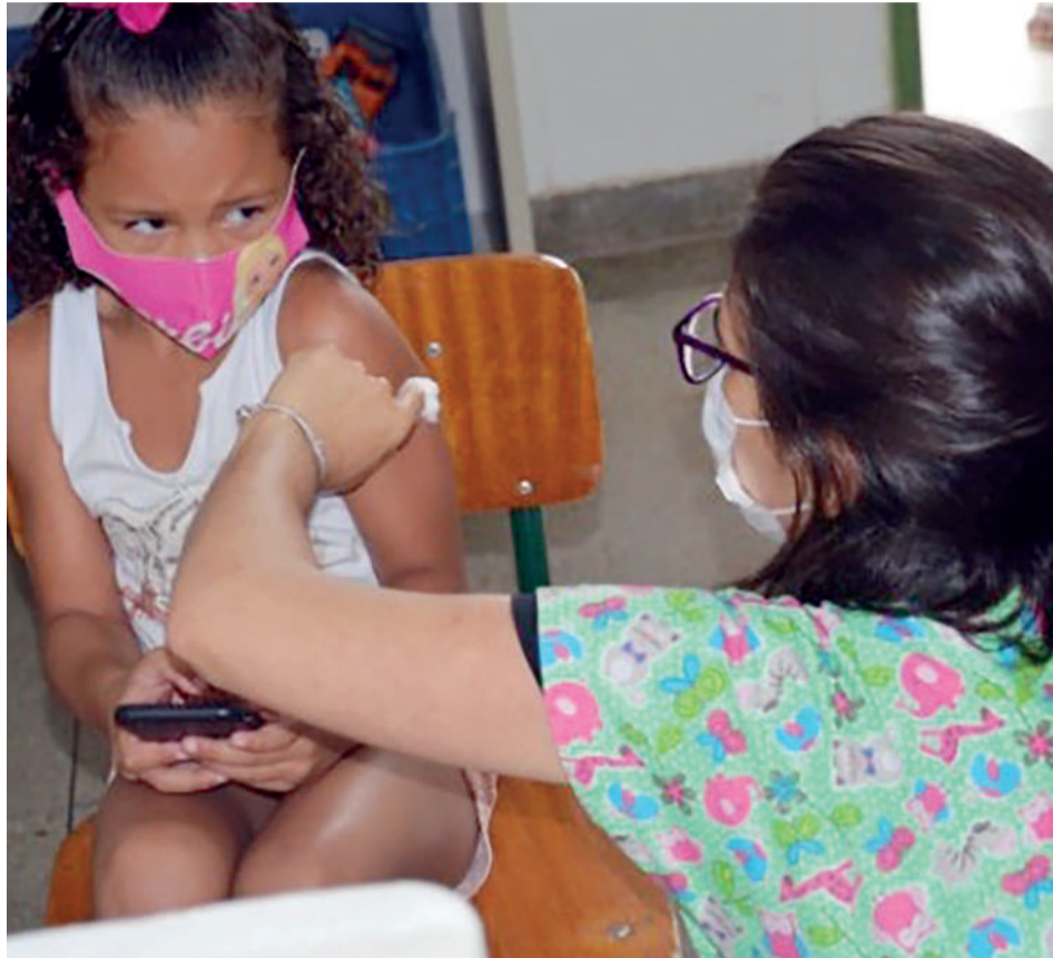
Prefeitura de Goiânia atende mais de 72 mil alunos da rede municipal de Educação no Programa Saúde na Escola: projeto propicia o pleno desenvolvimento das crianças matriculadas na rede

nos e, conseqüentemente, as famílias. Dentre elas, estão: prevenção à Covid-19; combate ao mosquito Aedes aegypti ; verificação a situação do cartão vacinal; prevenção do sobrepeso e obesidade; prevenção ao uso de álcool tabaco crack e outras drogas; prevenção das violências e dos acidentes; identificação dos