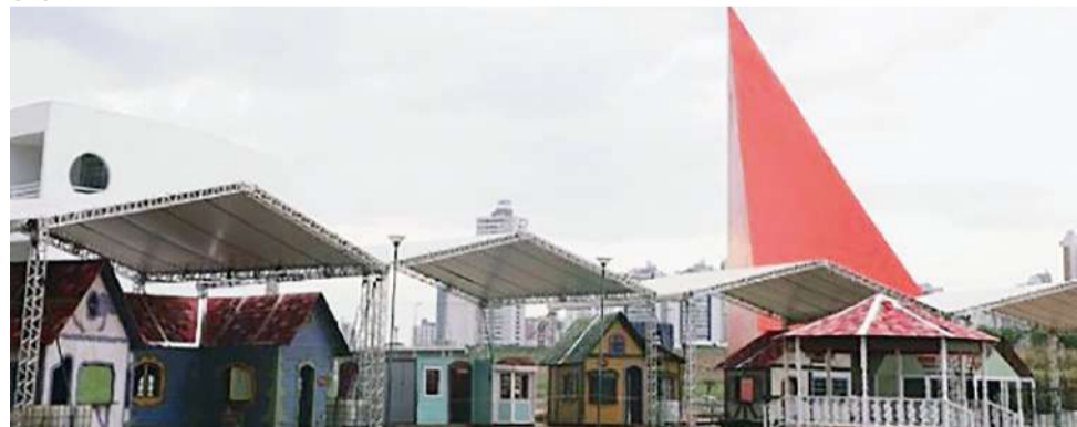
Montagem do Natal do Bem 2022, no Centro Cultural Oscar Niemeyer

DA REDAÇÃO - Em decorrência das fortes chuvas registradas na tarde da última segunda-feira (28), o Governo de Goiás e a Organização das Voluntárias de Goiás (OVG) informaram que o lançamento do Natal do Bem 2022, programado para esta terça-feira (29), foi adiado para o dia 3 de dezembro, próximo sábado.