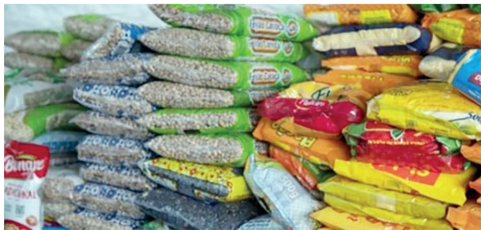
Os alimentos serão doados às famílias em situação de vulnerabilidade social do município

A ação é uma iniciativa da Prefeitura de Novo Gama, em parceria com as secretarias municipais de