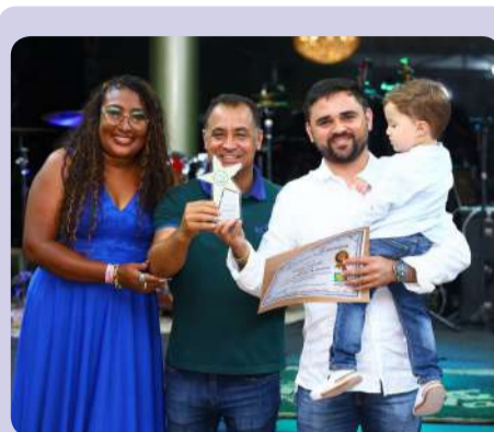
■ José Gerlsndio da Thiago Calçados