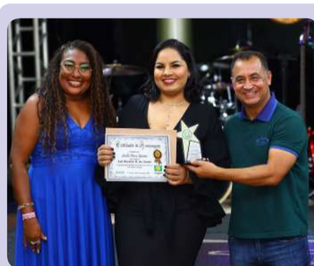
■ Lais da empresa Sushi Novo Gama