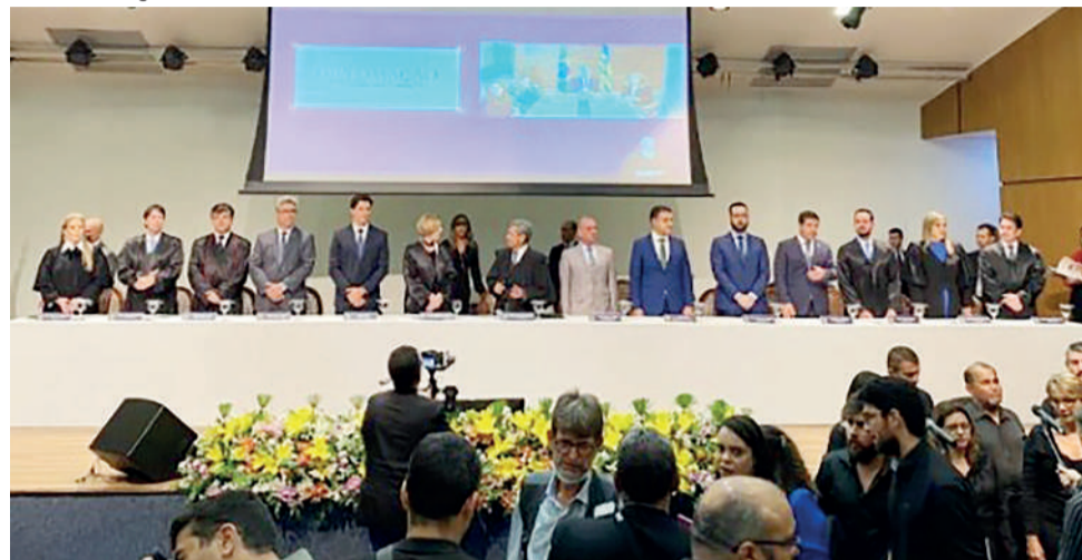
Governador, vice, deputados e senador eleitos são diplomados em Goiânia, Goiás

DA REDAÇÃO - Os deputados eleitos, em 30 de outubro, para a 20ª Legislatura da Assembleia Legislativa de Goiás (Alego), foram diplomados em cerimônia na sede do Tribunal de Contas do Estado de Goiás (TCE), nesta segunda-feira, 19 de dezembro.