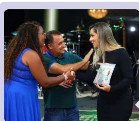
■ Thays Gerente Geral Sicoob Novo gama