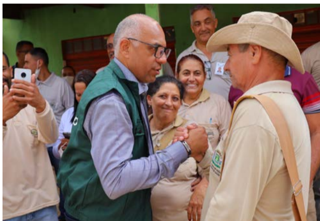
Prefeito Rogério Cruz atualiza tabela de vencimentos de agentes comunitários de saúde e de combate às endemias, do município de Goiânia, e projeto de lei foi aprovado, em votação definitiva

A atualização da tabela de vencimento dos servidores altera a Lei Complementar nº 2.236/12, que criou os cargos de Agente Comunitário de Saúde e de Agente de Combate às Endemias, em atendimento à Emenda Constitucional nº 2.120/22. A quantidade de servidores dessas duas categorias tem como base a folha de pagamento do mês de novembro de 2022.