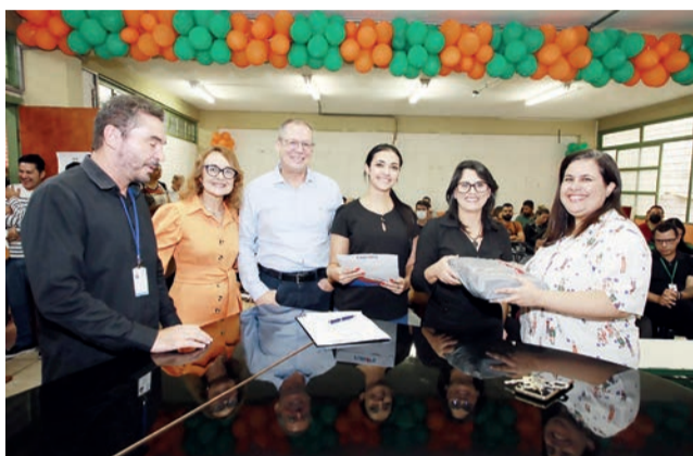
Colaboradores das Escolas do Futuro de Goiás e da Orquestra Filarmônica de Goiás recebem vale-alimentação com crédito retroativo a setembro

O auxílio-alimentação é de R$ 500,00 para todos os colaboradores, administrativos e docentes, com salário de até R$ 5.508,00, de acordo com a Lei Estadual nº 19.951/17. No caso das EFGs, o benefício está