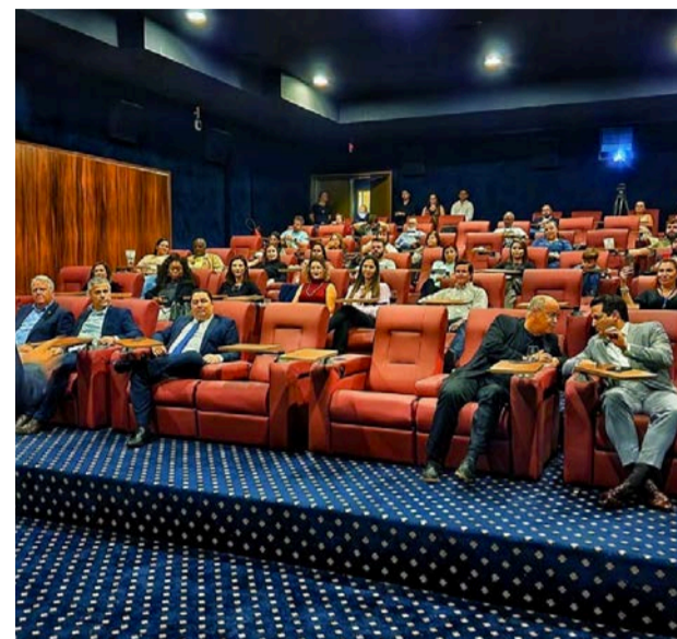
Salas de cinema do Centro Cultural Oscar Niemeyer se destacam por conforto e modernidade