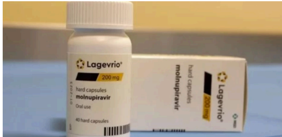
Medicamento Lagevrio (molnupiravir)

A venda do medicamento Lagevrio (molnupiravir), utilizado no tratamento da covid-19, para farmácias e hospitais particulares do país foi aprovada por unanimidade pela Agência Nacional de Vigilância Sanitária (Anvisa). A decisão autoriza o fornecimento do medicamento para o mercado privado, com a rotulagem em inglês, porém com entrega da bula e folheto informativo aos pacientes abordando as informações referentes à gravidez e lactação, em português.