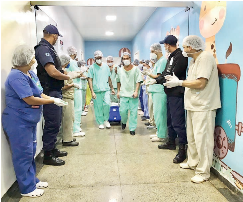
Operação atende a pacientes que aguardam na fila de espera no estado

queda da própria altura. A equipe médica do hospital prestou toda assistência realizando exames clínicos e de imagem, chegando à conclusão da morte encefálica da paciente. “Após todo esse processo fizemos contato com a família sobre o óbito, e os próprios familiares já levantaram a hipótese para a doação de órgãos. Fizemos a entrevista e a doação foi