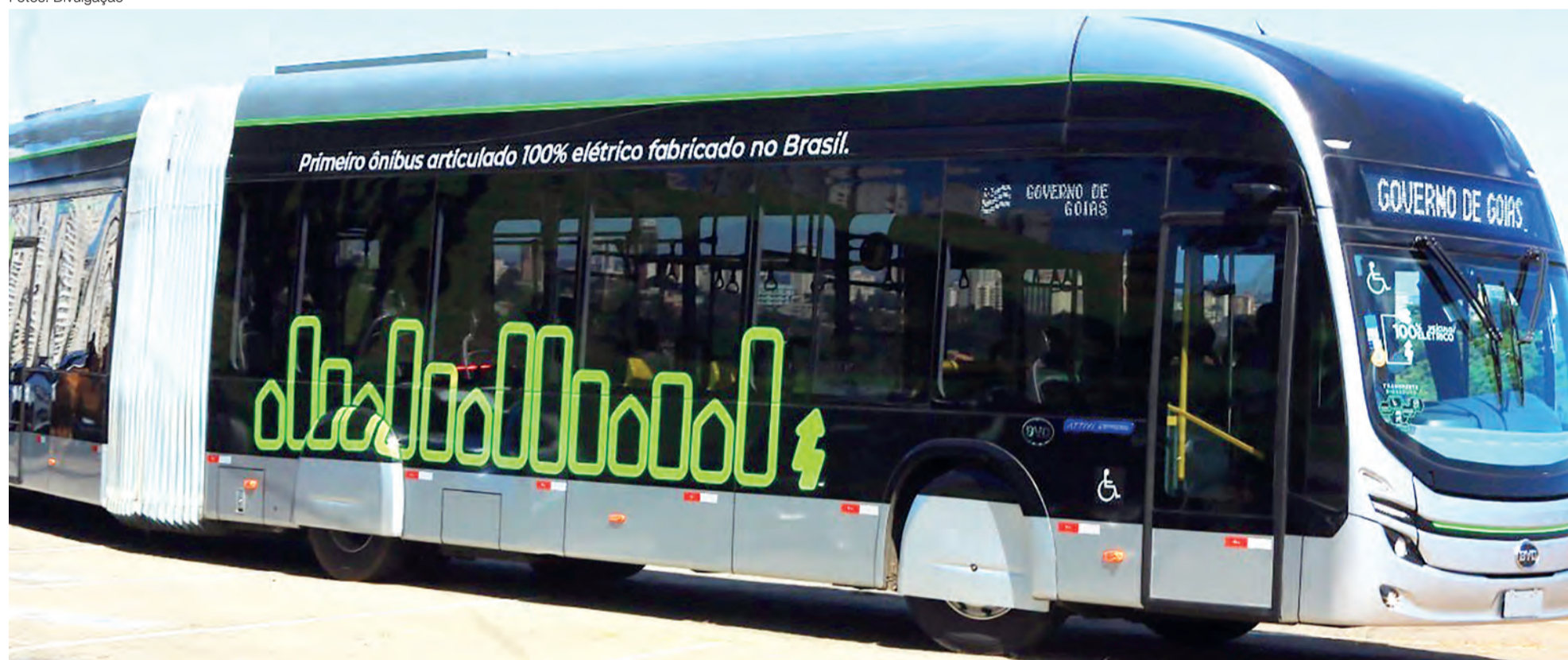
Eixo Anhanguera adota sistema operacional sustentável e zero poluente