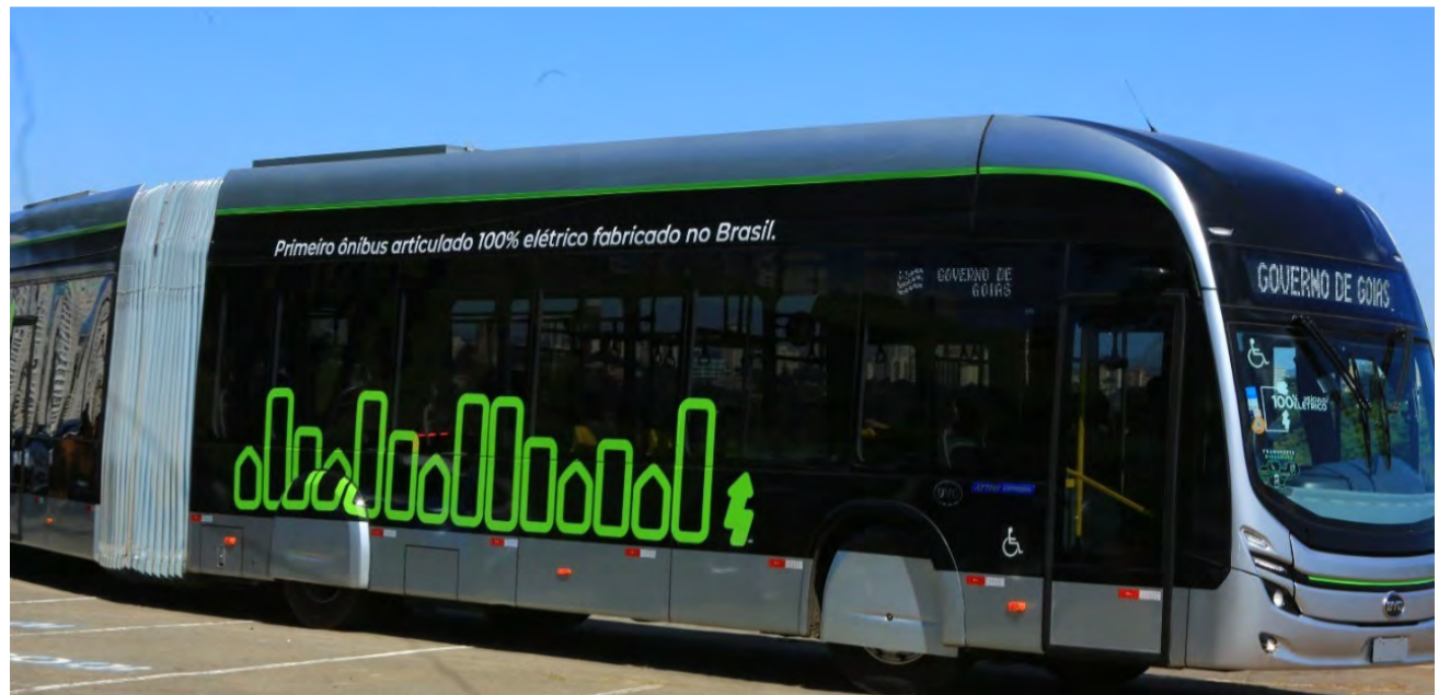
Eixo Anhanguera adota sistema operacional sustentável e zero poluente

br até às 8h59 do dia 27 de março de 2023.