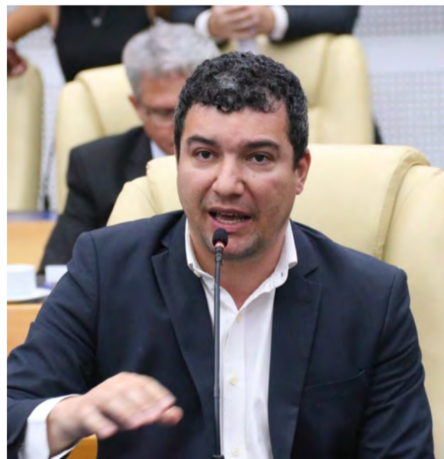
O projeto da Secretaria Municipal de Saúde visa triagem de pacientes a ser selecionados por banco de dados do SUS

O vereador destacou a necessidade de celeridade no processo para reduzir o sofrimento de milhares de pessoas que buscam atendimento médico na Administração Municipal. A prefeitura poderá formalizar parcerias com entidades