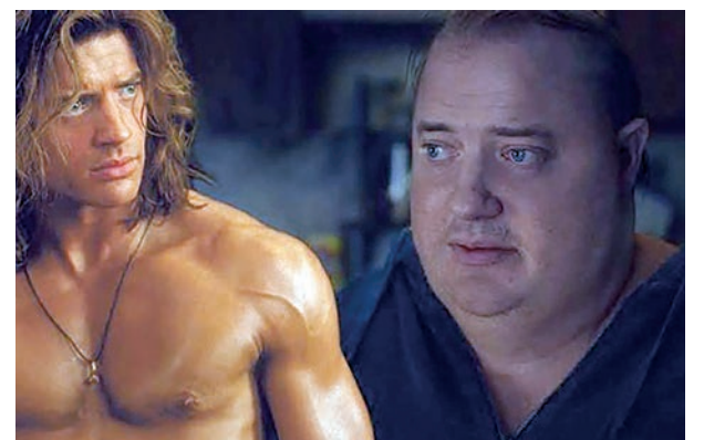
Transformação física do herói descamisado Brendan Fraser, protagonista de "A Baleia", choca os fãs. O tempo e a fama passam rápido, será que o ator merece o Oscar?