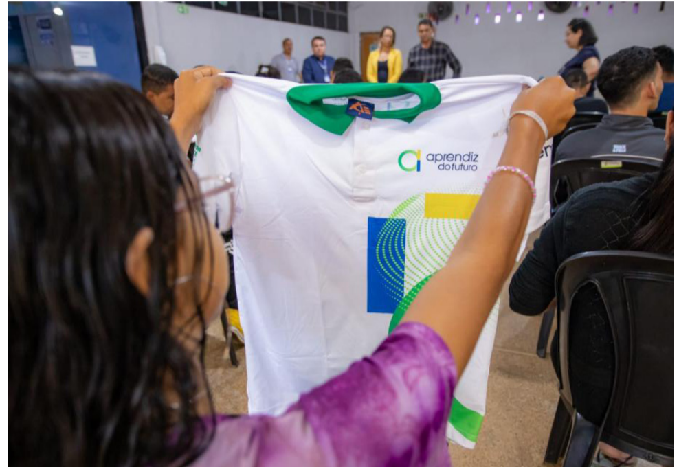
Foram distribuídos uniformes, crachás e tablets