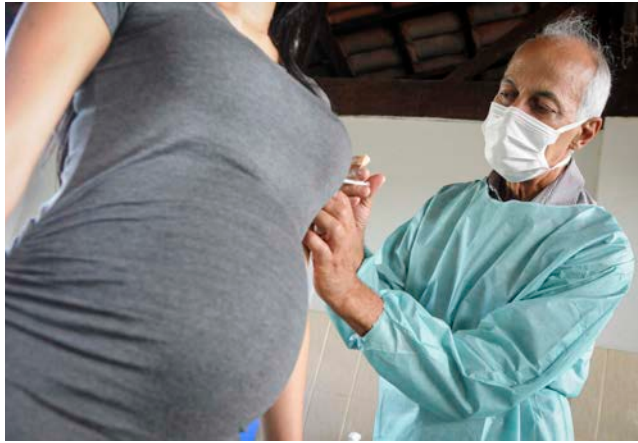
Grávidas ou puérperas que tenham tido filhos há até 45 dias poderão receber a vacina bivalente contra a covid-19 a partir de segunda (20). A orientação é comparecer com cartão de vacina e documento de identificação