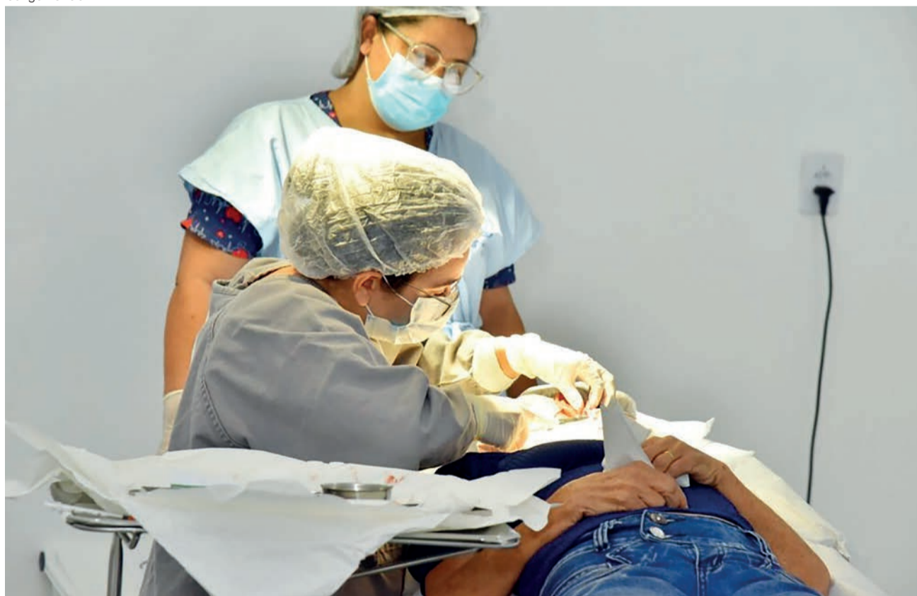
A ação ocorre neste sábado, 1, das 8 às 13h, no Centro de Especialidades

A força-tarefa vai ofertar 340 consultas em cardiologia, neuropediatria, ortopedia, otorrinolaringologia, neurologia, ginecologia, endocrinologia e odontologia. Também estão na programação 120 exames de ultrassonografia, 30 pequenas cirurgias e 30 procedimentos para inserção de Dispositivo Intrauterino (DIU) e colposcopia. Além disso, os pacientes do Centro de Especialidades terão à disposição testes rápidos para identificação e diagnóstico de Infecções Sexualmente Transmissíveis (IST's). Esses exames serão realizados por livre demanda, conforme inte-