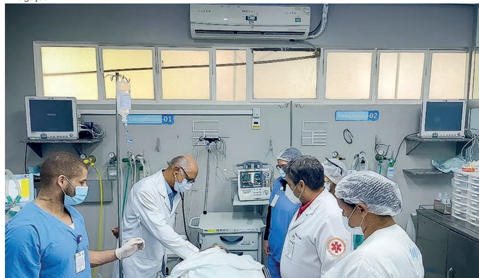
Equipe do protocolo AVC em atendimento de emergência no Hugo

te e a primeira de incapacidade no Brasil. Em Goiás, segundo dados do Ministério da Saúde, foram registradas 1.026 mortes pela doença, em 2020. Em 2021, o número subiu para 1.054 e, em 2022, para 1.194 óbitos. No ano passado, foram registradas 7.624 internações pela doença, média de 21 por dia.